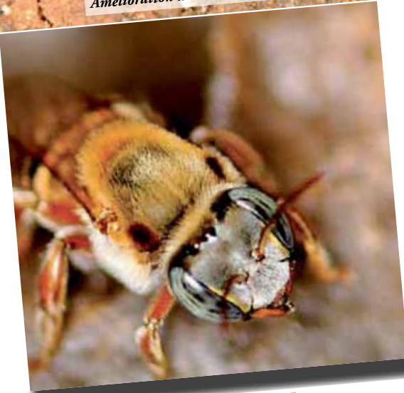
Amélioration d'un trou de vol

Je décidai donc d'approfondir cette autre apiculture, d'élargir ce savoir qui me faisait tant défaut afin de mettre des mots sur les nombreuses interrogations que la découverte de ces beautés et l'ouverture de ces caisses de bois avaient engendrées. Clairement, si l'émotion première était forte, il fallait que je m'informe encore plus, à la rencontre de cette ouvrière aux yeux bleus qui, pour moi aussi, en un instant, était devenue sacrée.